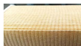
(Fig. 1) Goffratura della carta