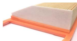
(Fig. 2) Feltro rigido di chiusura (TECNECO)