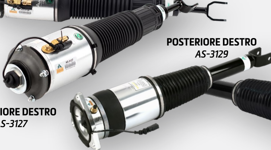
POSTERIORE DESTRO AS-3129