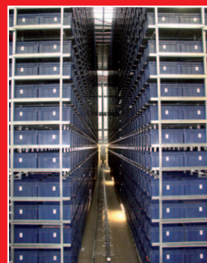
Il nuovo centro logistico garantisce spedizioni veloci dei ricambi.