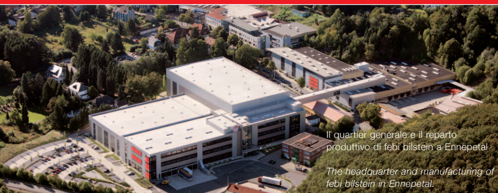
Il quartier generale e il reparto produttivo di febi bilstein a Ennepetal